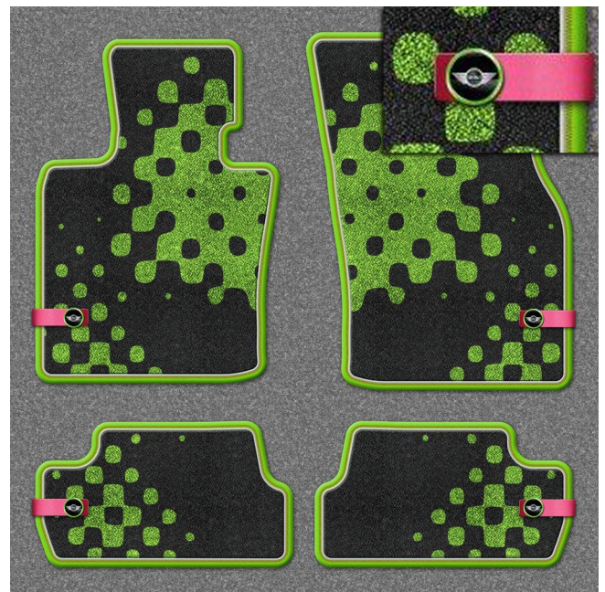
Fussmatte Textil VIVID GREEN

ESSENTIAL BLACK ist die Designlinie für anspruchsvolle MINI Kunden, die schlichte Eleganz mögen. Bei diesem Design ist alles aufs Wesentliche reduziert. Hochwertige Materialien verkörpern einen besonderen Anspruch. Die durchgehend schwarze Farbgebung bezeugt ein zeitloses Stilempfinden.