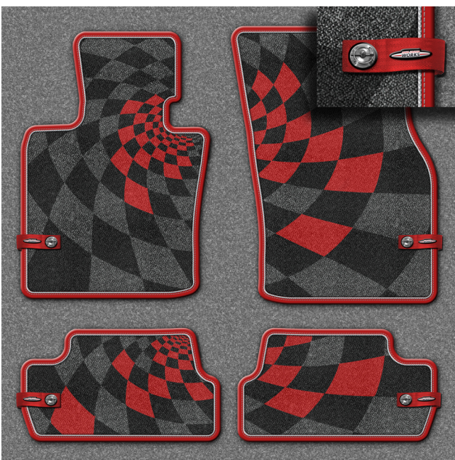
Fussmatte Textil JOHN COOPER WORKS PRO