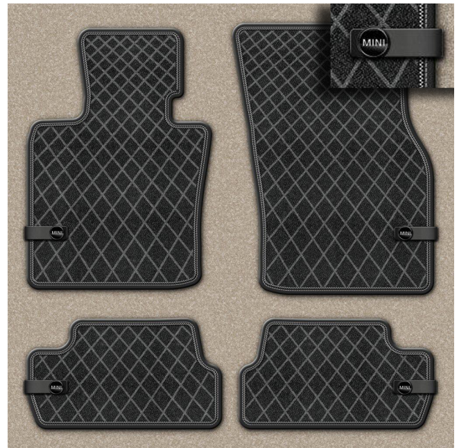
Fussmatte Textil ESSENTIAL BLACK