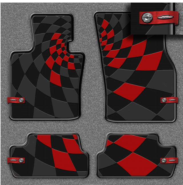
MINI Fussmatten Allwetter JOHN COOPER WORKS PRO