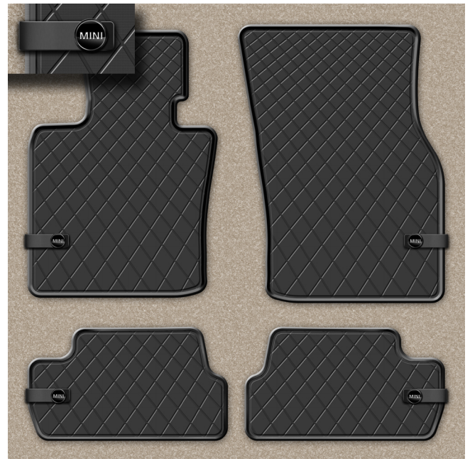
MINI Fussmatten Allwetter ESSENTIAL BLACK