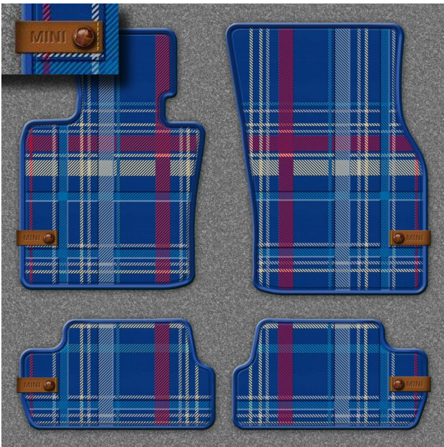
MINI Fussmatten Allwetter SPEEDWELL BLUE