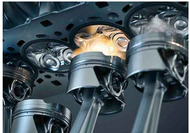
M Performance Power and Sound Kit