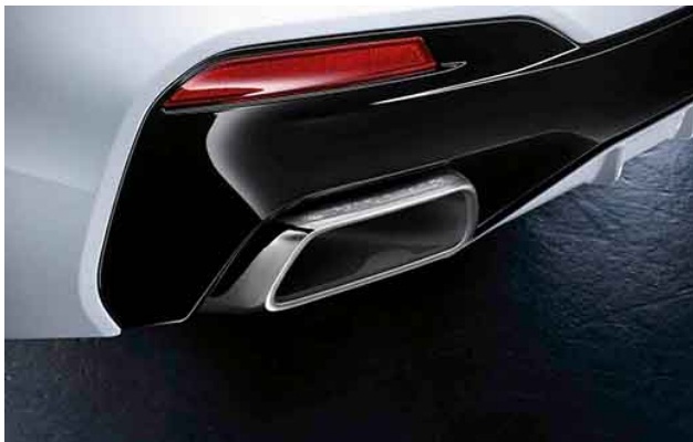
M Performance Schalldämpfer-System mit Endrohrblende Chrom